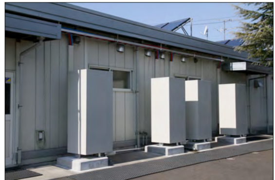
地上に設置された貯湯タンク

約16%を太陽で賄う。 原油換算 1,016リットル/年 CO2削減 2,900kg/年